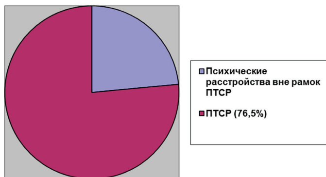
Рисунок 1. Наличие психотравмирующих стрессовых расстройств (%)

Вместе с тем до сих пор остаются недостаточно изученными особенности состояния психического здоровья участников военных действий.